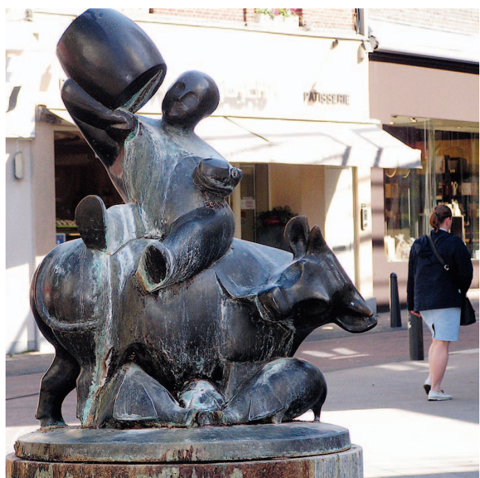
Erinnert an die Genever-Produktion: Das Hasselter „Borrelmanneke“ (hier das Original) entsteht in Detmold als Kopie.